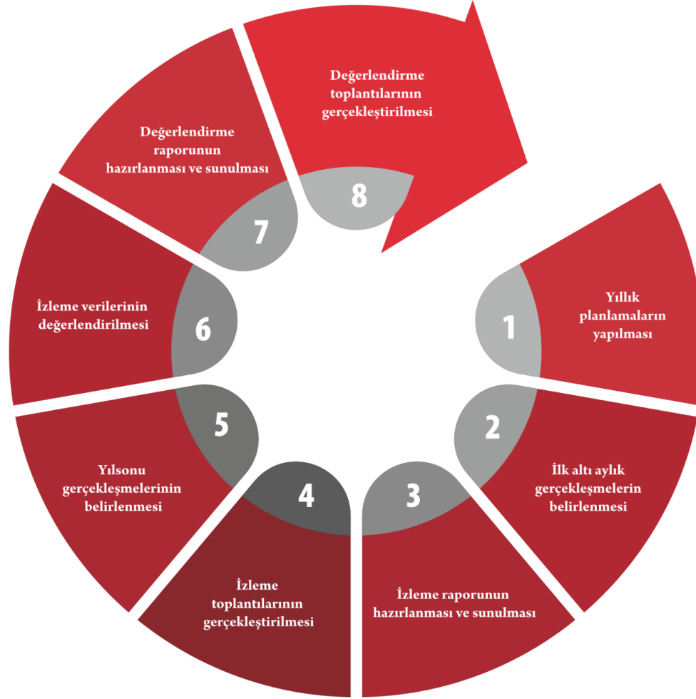
Şekil 2. İzleme Değerlendirme Süreci